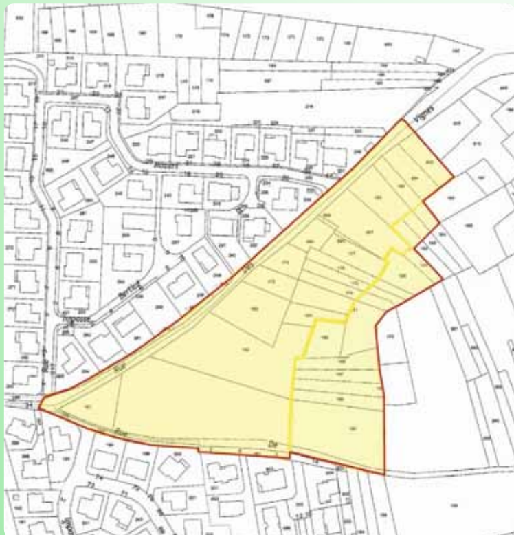
Secteur de la Condamine